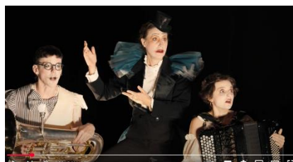
Horace le coucou (Jeune public) Musique d'Alexandros Markeas Mise en scène Edouard Signolet