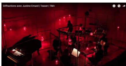
Diffractions avec Justine Emard