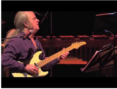
Julia Wolfe « Reeling »