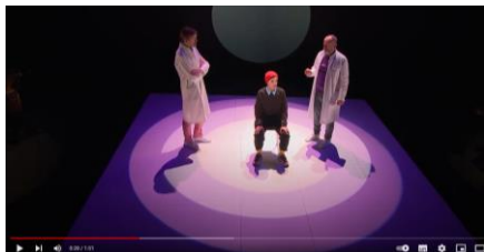
La Vallée de l'étonnement Musique d'Alexandros Markeas Mise en scène Sylvain Maurice