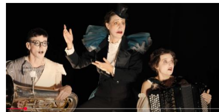
Horace le coucou (Jeune public) Musique de Alexandros Markeas Mise en scène Edouard Signolet