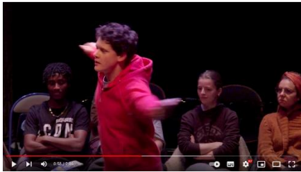
Être d'ailleurs avec le comédien Loreznzo Lefebvre