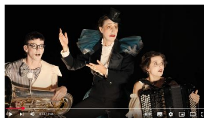
Horace le coucou (Jeune public) Musique de Alexandros Markeas Mise en scène Edouard Signolet